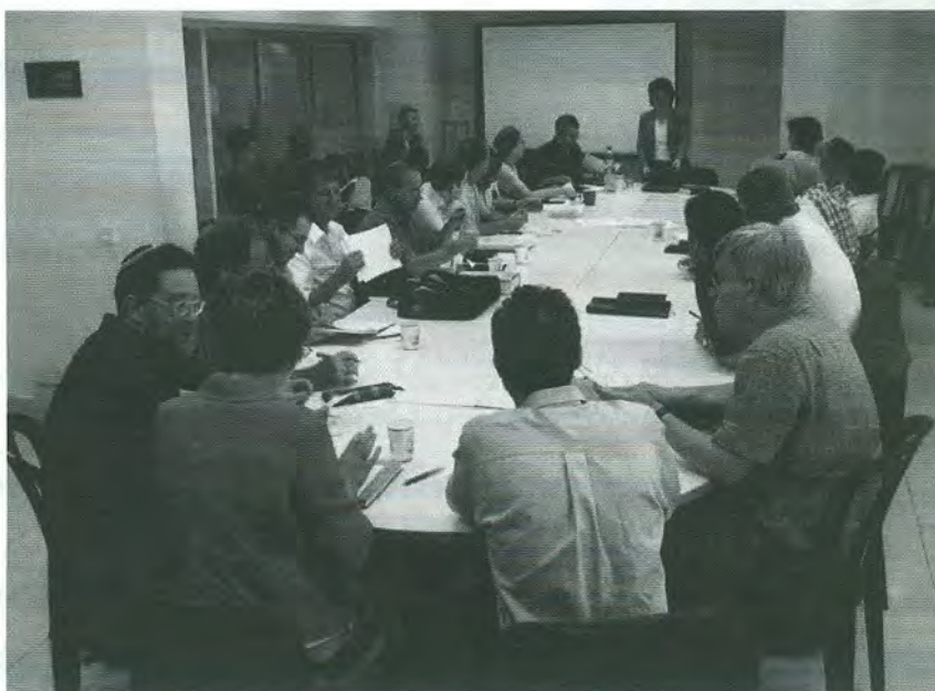
תמונה מאחת הסדנאות שהתקיימו בזמן הכינוס

דברי הכינוס יפורסמו בכרך האחד-עשר של הסדרה של מרכז אוריון.